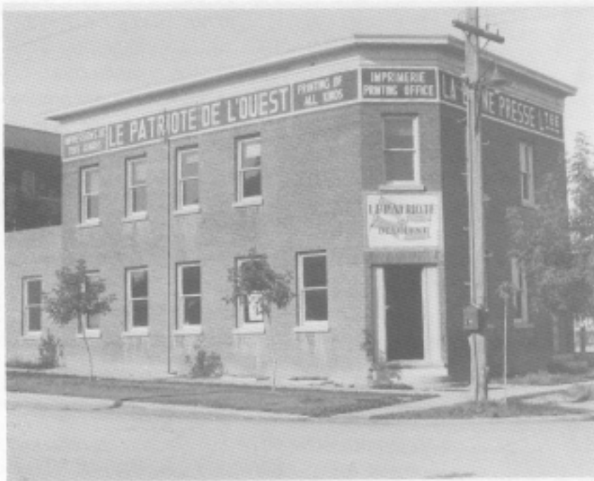
L'édifice du Patriote de l'Ouest à Prince Albert.